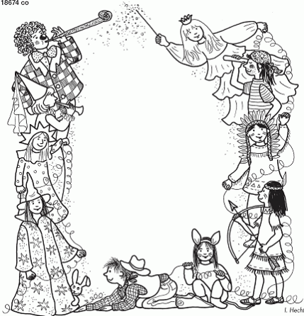
Prinzessin, Clown und General - wer feiert mit im Karneval?!